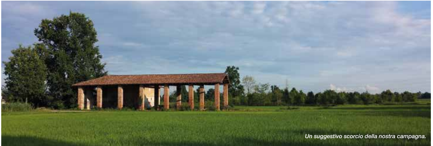
Un suggestivo scorcio della nostra campagna.